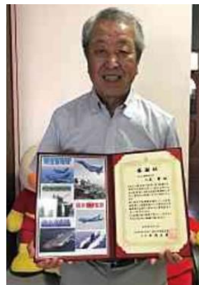
感謝状を手にする八木特別会員