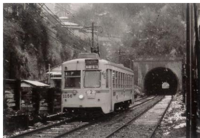
本牧方面へのトンネル昔と今

横浜市電には冷房がなかったので夏は前面の窓を開けて走行します。トンネルへいると涼しくなりました。その先の本牧地区は30年程前から大ショッピングセンターになっていますが自家用車以外ではバス路線しかないの陸の孤島の感があります。写真をご覧いただくとおわかりでしょうがトンネルは今も本牧方面への一方通行の道として生きています。