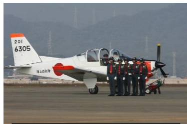
パイロット学生課程

「事に臨んでは危険を顧みず身をもって職務を完遂する」ことを宣誓した自衛官には一般の人とは異なる気力、体力、忍耐力等が求められるのは当然であり、自衛官は厳しい教育訓練を通じてこの素養を身につける。私もパイロット学生当時に教官から罵詈雑言を浴びせられ、時にはヘルメットの上から叩かれながらの指導に耐えた思い出がある（現在ではそうした指導は行われていない）が、それは飛行中のミスは即命を落とすことにつながることを知らしめる文字通りの苦痛を伴う躰でもあった。指導を受ける立場であった自分は、自身の努力不足が指摘されていることを十分自覚して