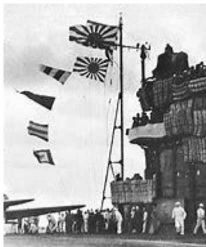
空母赤城に上がる戦闘旗

これを戦闘旗と呼称する。 (注)通常は戦闘開始になると、艦尾旗竿の艦旗は邪魔になるし、近代海戦では艦尾旗竿は倒されることが多く、掲揚されない(後部大檣頂に掲揚されたもので、これに代える。)但し前大戦までは、両方に掲揚された例もある。