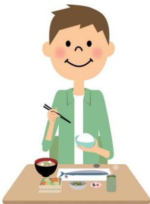
和食で国の安全に貢献

さあ皆さん、地産地消の食料食材を用いた本食・和食を食べて、我が国の農業・漁業を助けるとともに、食料自給率の向上を図りましょう!!