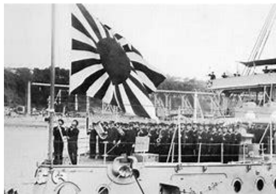
帝国海軍の軍艦旗掲揚

うに軍艦旗の掲揚・降下は極めて荘厳な儀式の下で実施される。海軍軍人は軍艦旗に対しては最大の敬虔を持ち、常に軍艦旗の下に死所を得ることを最大の念願とする。東郷元帥の「海軍軍人は軍艦旗を眺めておればよい」はこの間の精神を端的に表現している。