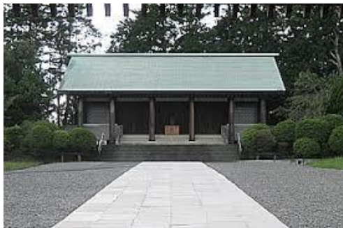
神奈川県戦没者慰霊堂