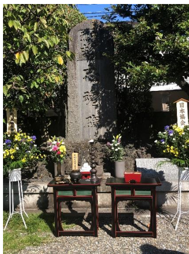
殉国六十烈士忠魂碑

が執り行われており、慰霊祭には地元選出の国会議員、県会議員はじめ関連団体の代表者が参列しています。今年の慰霊祭は十月二十日コロナ禍のため参列者を限定して実施され、神奈川県隊友会からは県会長が参列しました。