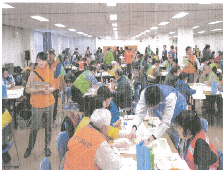
第13回静岡県内外の災害ボランティアによる救援活動のための図上訓練の様子