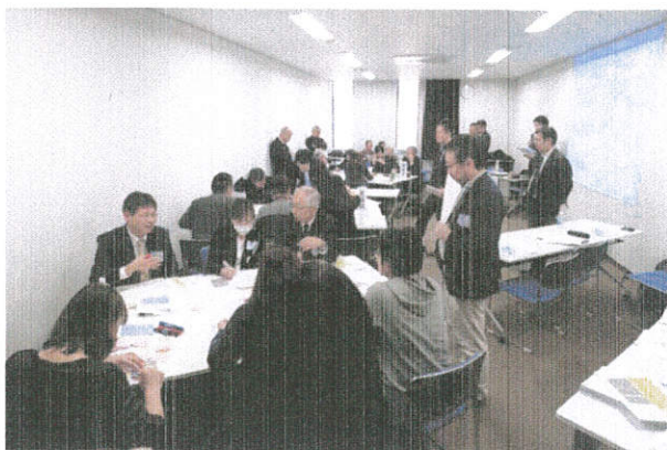
広島市災害ボランティア本部運営ワークショップの様子（平成30年3月）

広島市では、平成26年の土砂災害を受けて改定された広島市災害ボランティア本部マニュアルに基づき、「広島市災害ボランティア活動連絡調整会議」を中心として、平成30年3月に広島市災害ボランティア本部の運営ワークショップが行われました。地域の取組を進める動きとして各地でも同様の取組が期待されます。